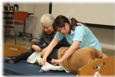
オムツのあて方(体験)