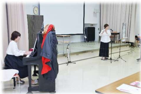
ミュージックココ(演奏)