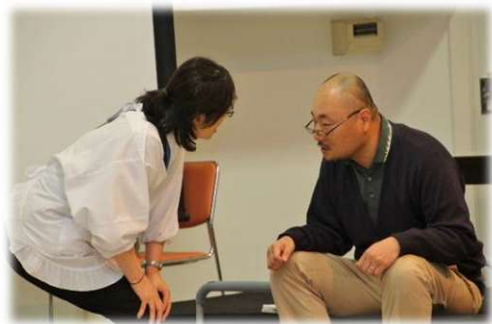
ユマニチュード(寸劇)

地域交流多国山ホールで、「家庭でもできる認知症ケア技法ユマニチュード」をテーマにご自宅で誰でもすぐに実践できる認知症ケアについて寸劇を交えて紹介しました。また、高齢期を健やかに過ごすために、介護予防「きくち体操」・介護技術講座「オムツの種類・選び方・着け方」・介護食「ソフト食」の試食と説明等、体験を通して知識を習得して頂きました。最後にミュージックココの演奏に合わせて、参加者も大きな声で合唱し、大いに盛り上がりました。多くのご参加ありがとうございました。