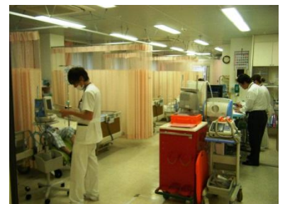
【シミズ病院脳卒中センター開設】